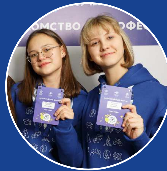
Старшие классы 15-17 лет