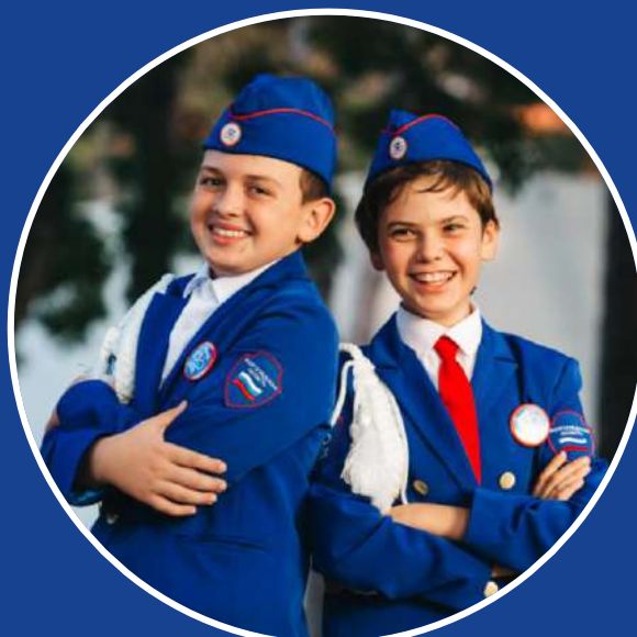
Средняя школа, 10-14 лет