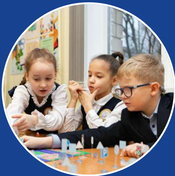
Дошкольники и младшие школьники, 5-9 лет

Активности разработаны с учетом особенностей восприятия информации каждой возрастной группой, что позволяет достичь наилучшего результата