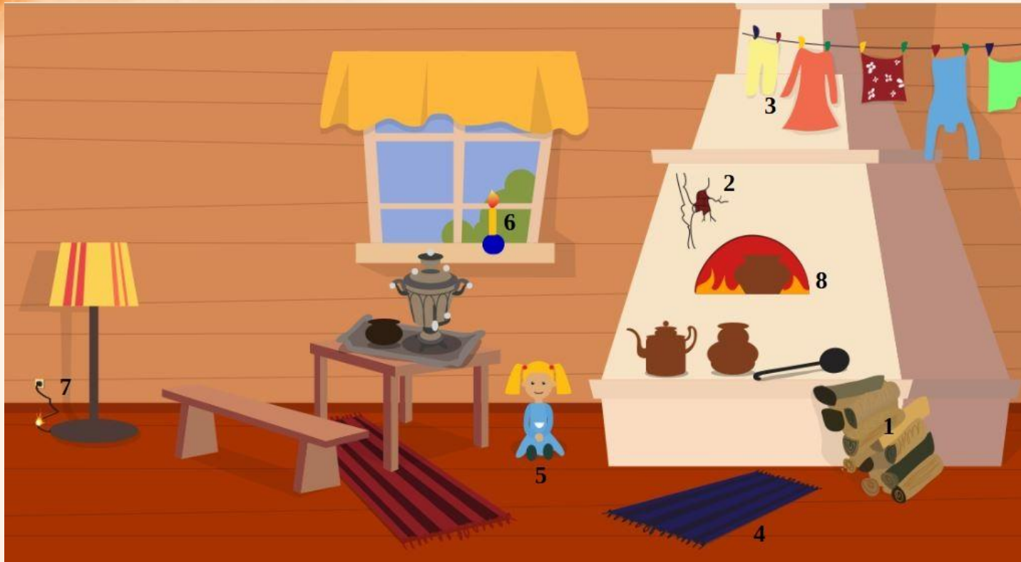
Рис. 1 Проверь найденные нарушения пожарной безопасности в доме