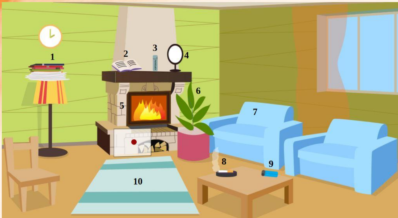
Рис. 4 Проверь найденные нарушения пожарной безопасности в гостиной