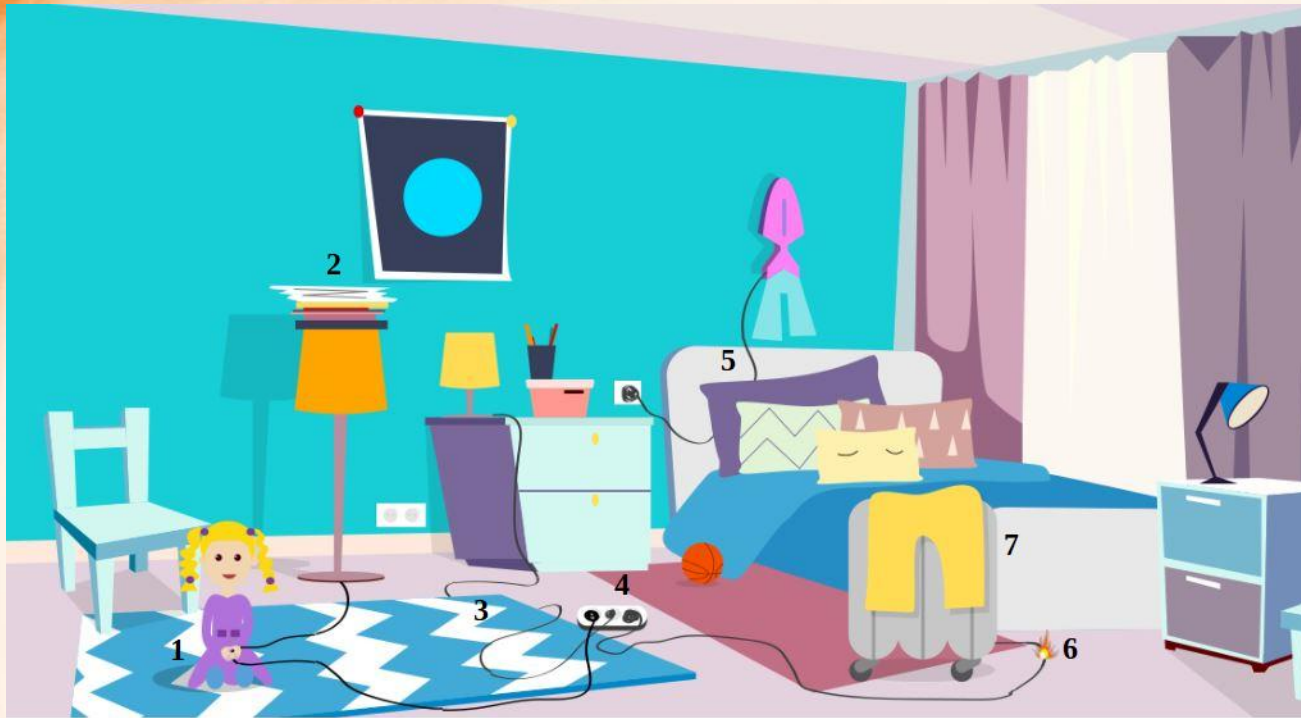
Рис. 5 Проверь найденные нарушения пожарной безопасности в детской