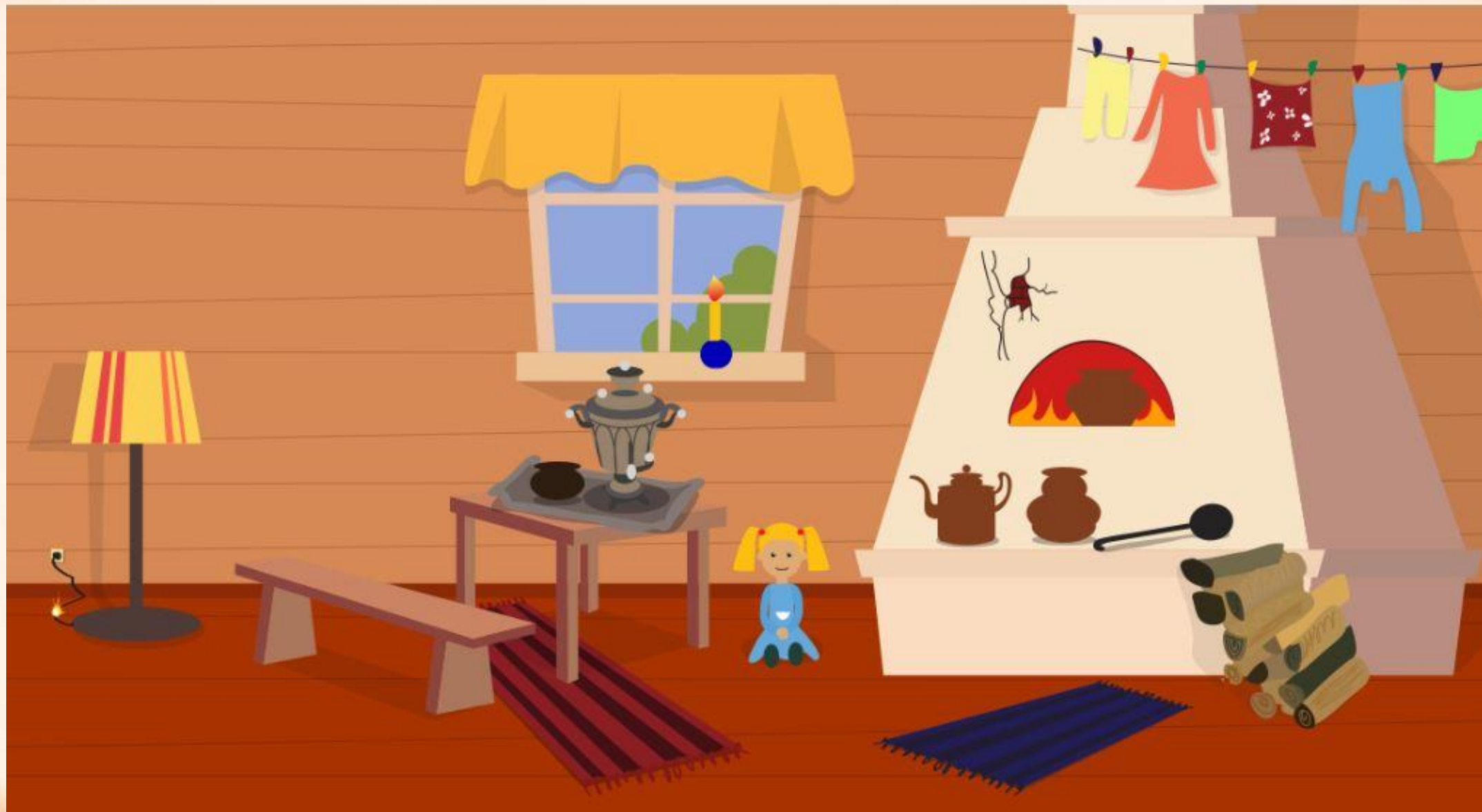
Рис. 1 Найди нарушения пожарной безопасности в доме (8 нарушений)