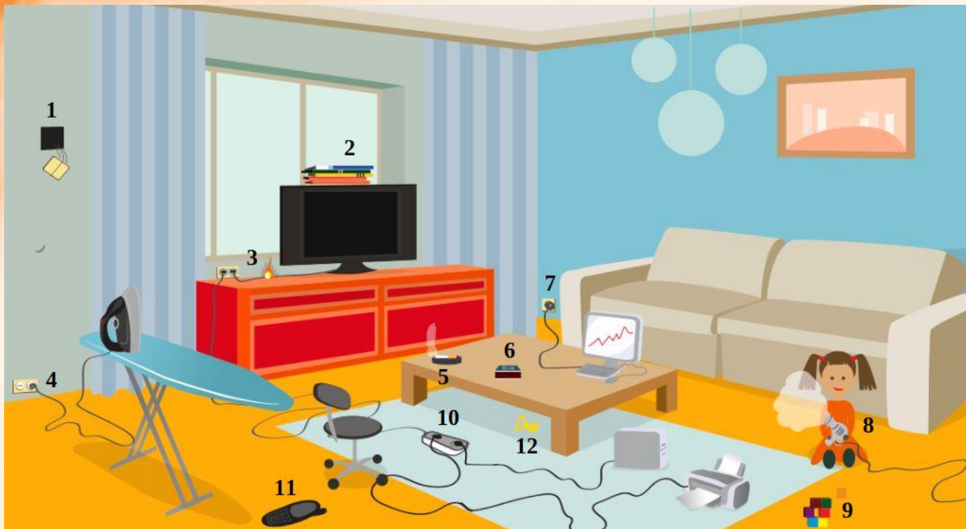
Рис. 3 Проверь найденные нарушения пожарной безопасности в гостиной